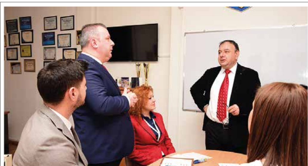
Aspect dintr-o ședință de analiză pentru elaborarea statutului comunei Brazi, Prahova

Cadrul legal: Ordinul nr. 25/2021 pentru aprobarea modelului orientativ al statutului unității administrativ-teritoriale, precum și a modelului orientativ al regulamentului de organizare și funcționare a consiliului local, publicat în MOF nr. 76 - 25/01/2021.